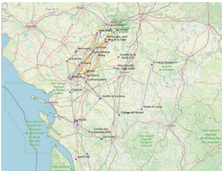
Cartographie des déplacements des Murins à oreilles échancrées de 2017 à 2023

*dans la limite de 5% de votre chiffre d'affaires