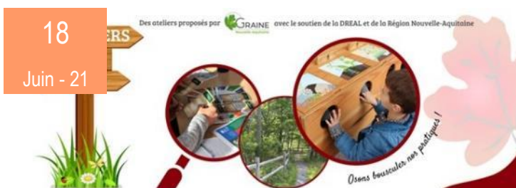
Continuons à bousculer nos pratiques et à échanger. FNE NA participe à l'atelier Visio EEDD proposé par le GRAINE NA "Loire Grandeur Nature »"