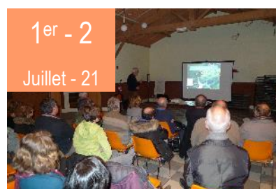
Séminaire directeurs-trices coordinateurs-trices de FNE

Retrouvez-nous sur fne-nouvelleaquitaine.fr