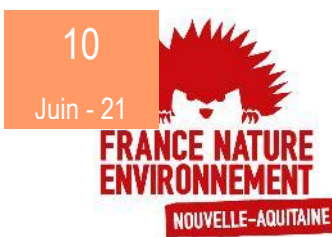
Rencontre avec Madame la Préfète de région