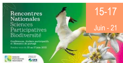
Sciences participatives Biodiversité